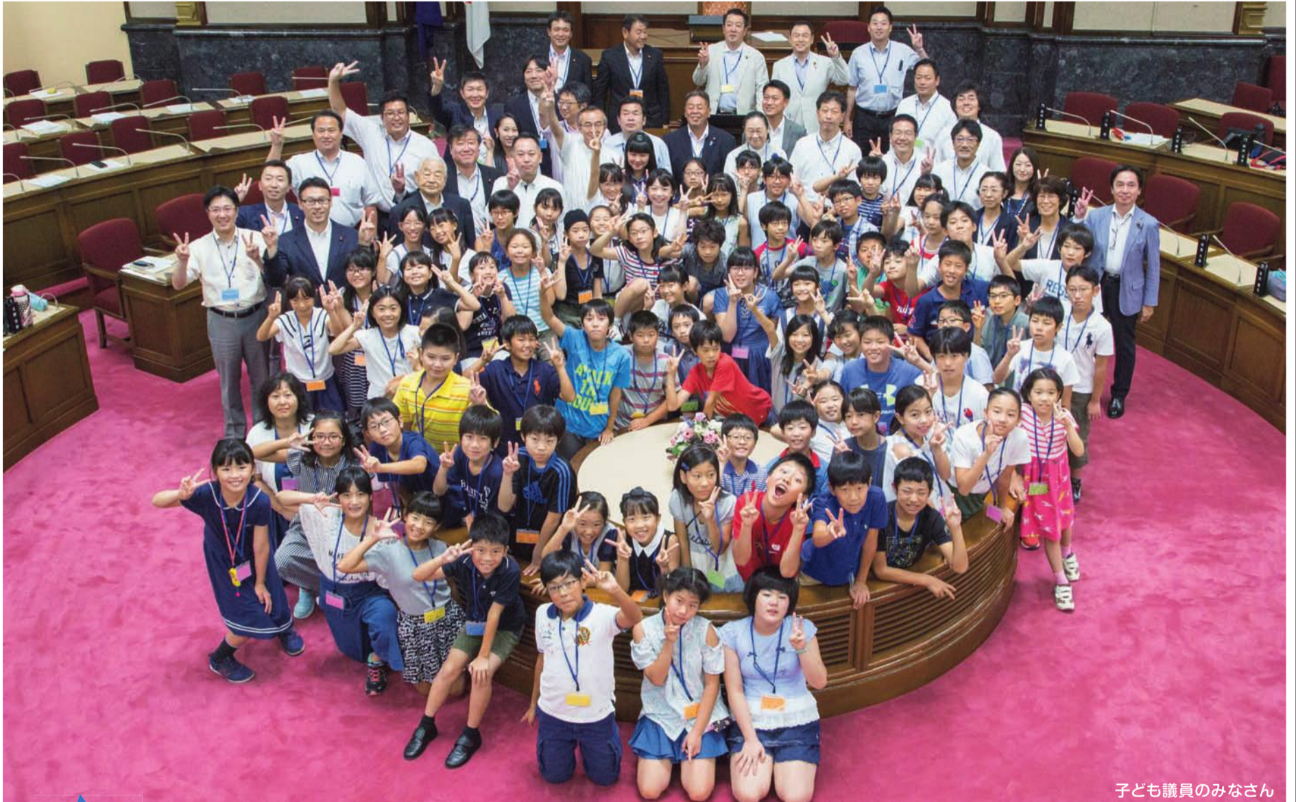
子ども議員のみなさん