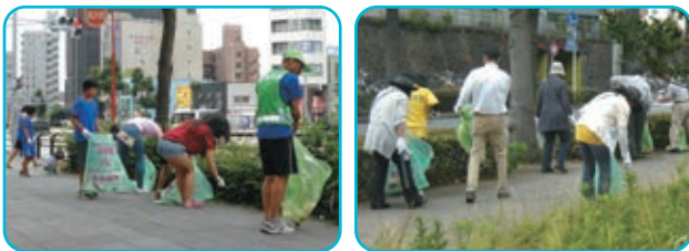
昨年の清掃活動の様子