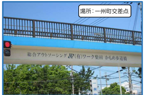
場所:一州町交差点