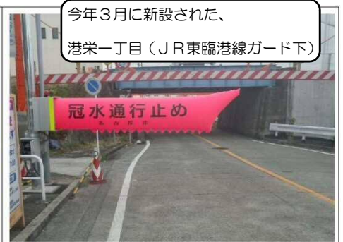
今年3月に新設された、港栄一丁目(JR東臨港線ガード下)