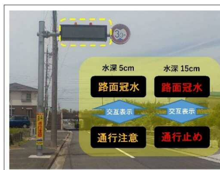
冠水警報装置(情報板)

水位センサーと連動し通行止め水位に達した時点で自動的に膨らみ、アンダーパスの手前で道路を封鎖します。