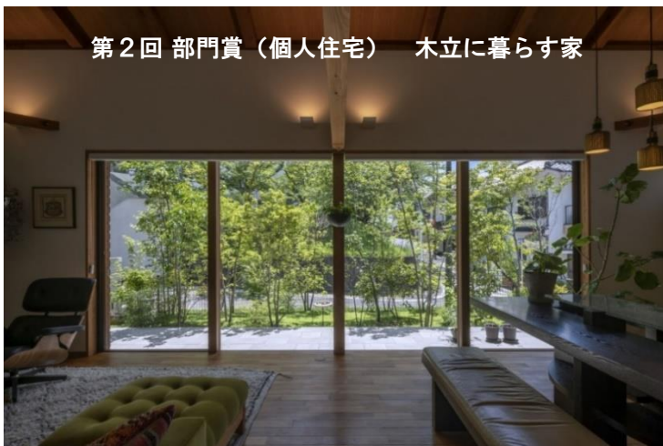
第2回 部門賞（個人住宅） 木立に暮らす家