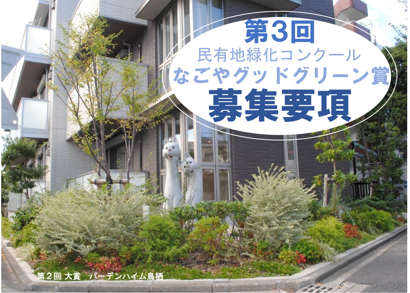
第2回 大賞 バーデンハイム鳥栖