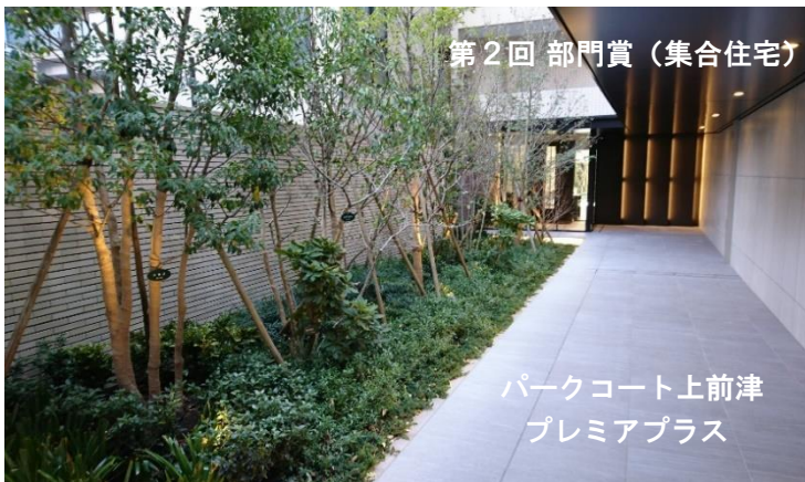
第2回 部門賞（集合住宅）