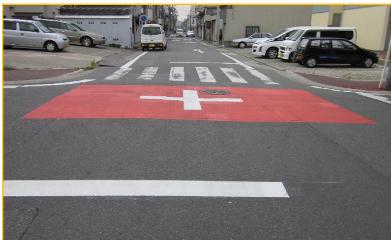
③交差点の明確化(カラー化)