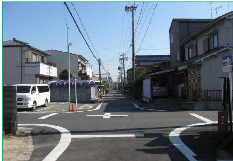
②交差点付近の明確化(区画線)