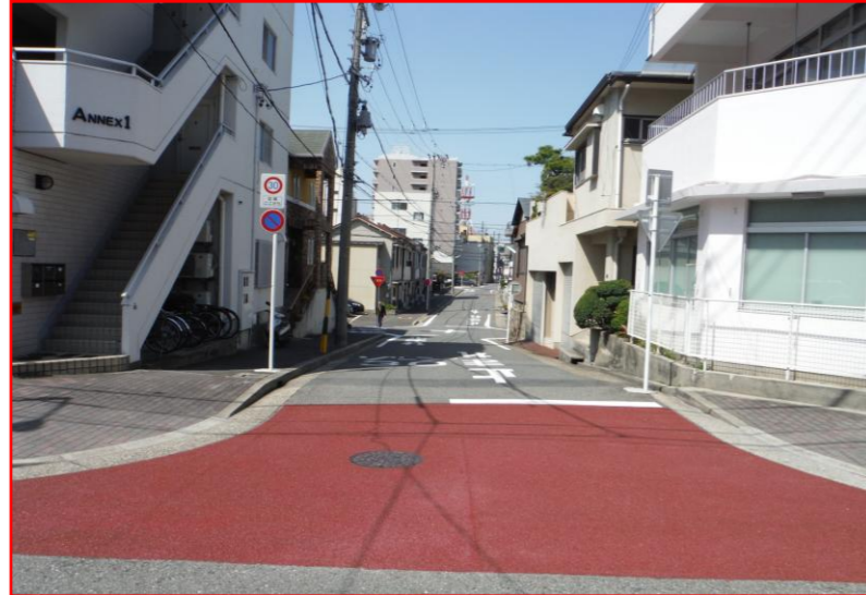
①対策範囲入口の明確化