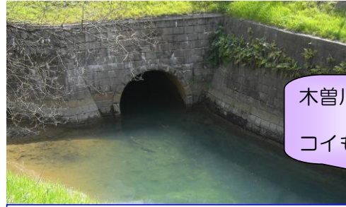
堀川への導水地点(猿投橋下流)

導水量：最大 0.4m 3 /s 導水期間：平成 19年4月22日から 平成 22年3月22日まで