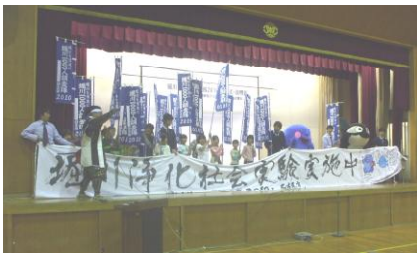
結成式 (平成19年4月22日) 165隊 2,262人 (結成時)