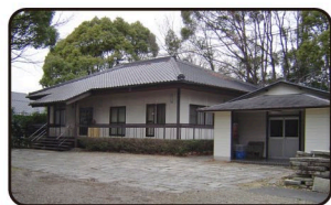
唐九郎(翠松園陶芸)記念館