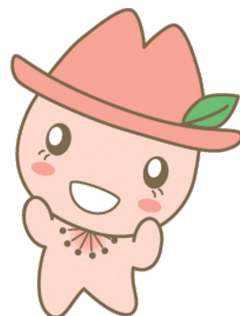
瑞穂区マスコットキャラクター みずほっぺ