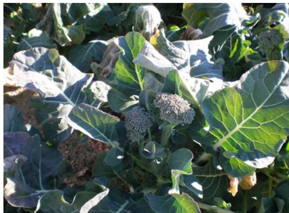
(←写真左) 「茎ブロッコリー」