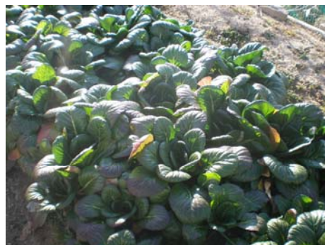
(↑写真上)「チンゲン菜」