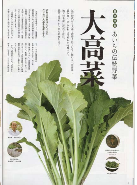
【緑区フリモ 11月号掲載】