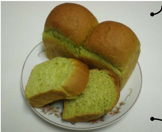
【大高菜を使ったパン】