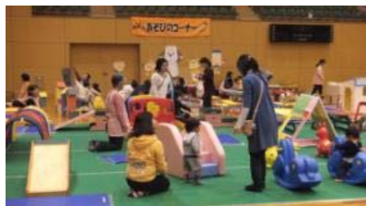
子育てふれあい広場