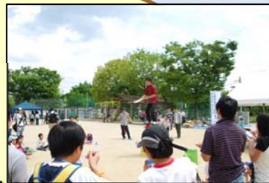
▼地域イベント担い手派遣