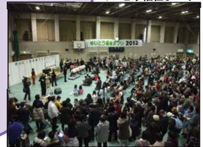
▼めいとう福祉まつり