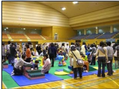
▲子育てふれあい広場