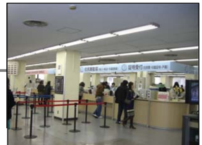
▼区役所における窓口サービス

個々の事業の詳細を掲載した「つながる・ひろがる名東プラン2012」は、区役所等で配布するとともに名東区ウェブサイト ( http://www.city.nagoya.jp/meito/ ) でも公開していますので、こちらもぜひご覧ください。