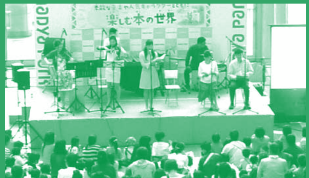
平成29年度なごやっ子読書イベントの様子