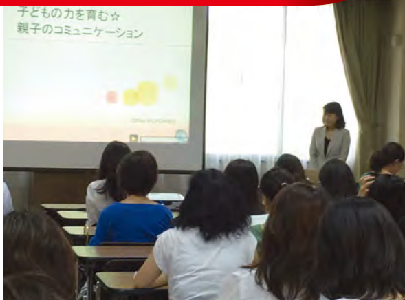
砂田橋小学校PTA 「増やそう子どもとの会話時間」大作戦 詳しくは P5 へ