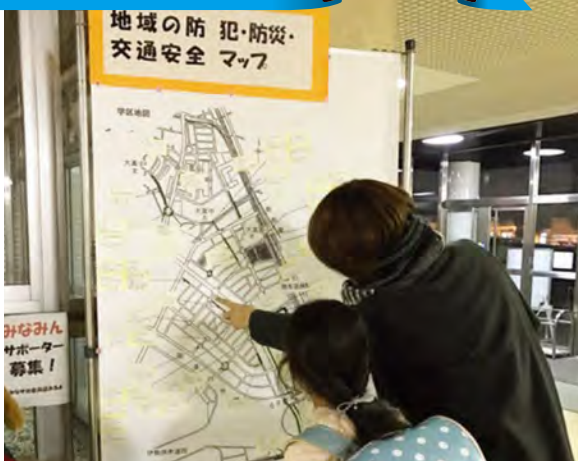
大高南小学校PTA 「親子で考えよう、地域の防犯・防災・交通安全」