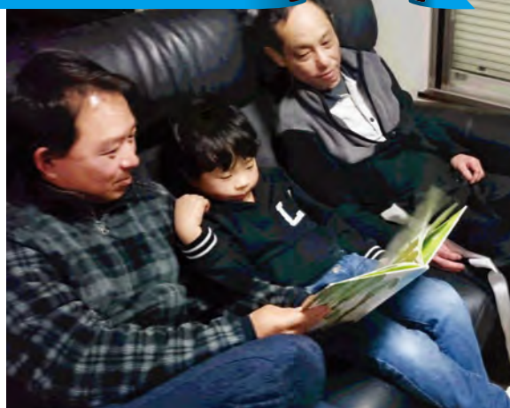
大野木小学校PTA 「夏休み 誰と読む？ 輪読！」