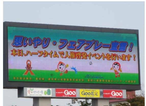
②オーロラビジョンの放映