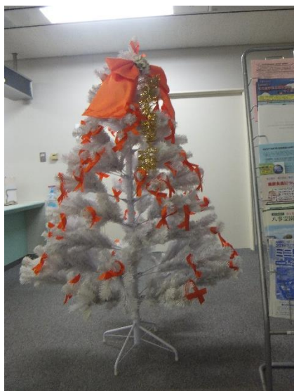
オレンジリボンツリーの設置