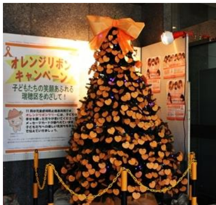
オレンジリボンツリー設置