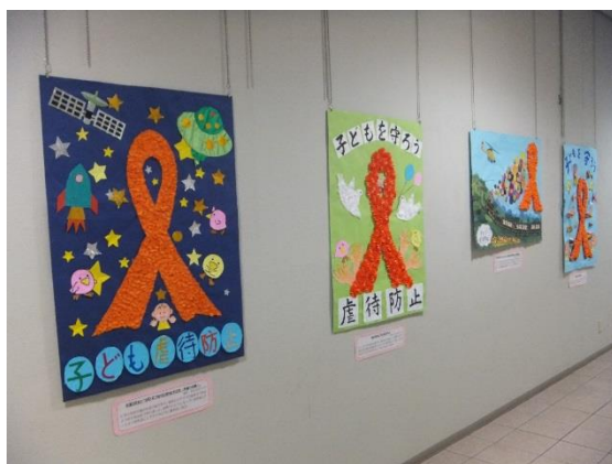
オレンジリボンモニュメントの掲示