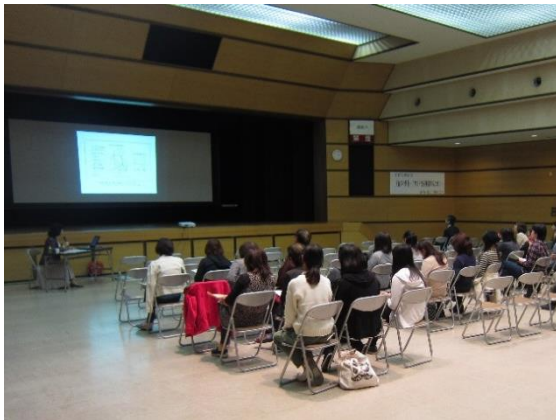
子育て講演会の開催