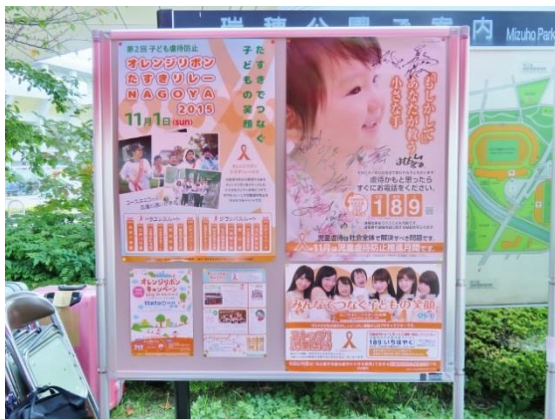
③ブースでのパネル展示