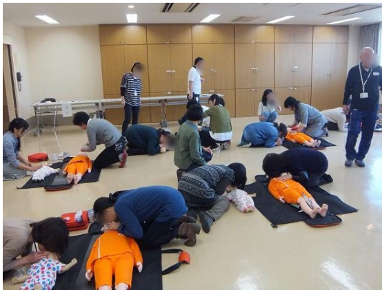
子育て支援者のための研修会