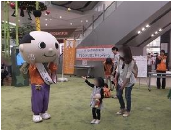
大型スーパーでの啓発イベント