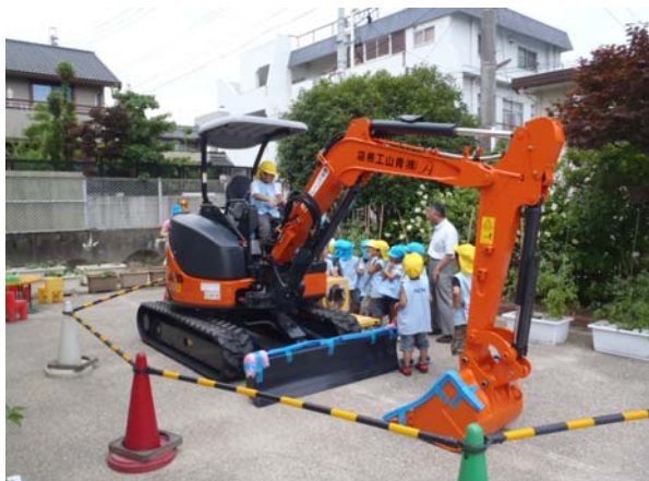
建設機械にふれ合う機会の提供