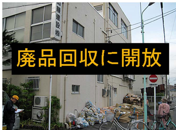
子供の誕生日に図書カードプレゼント 子供祭りや廃品回収に駐車場開放