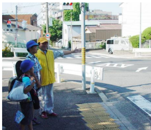
交通誘導のボランティア