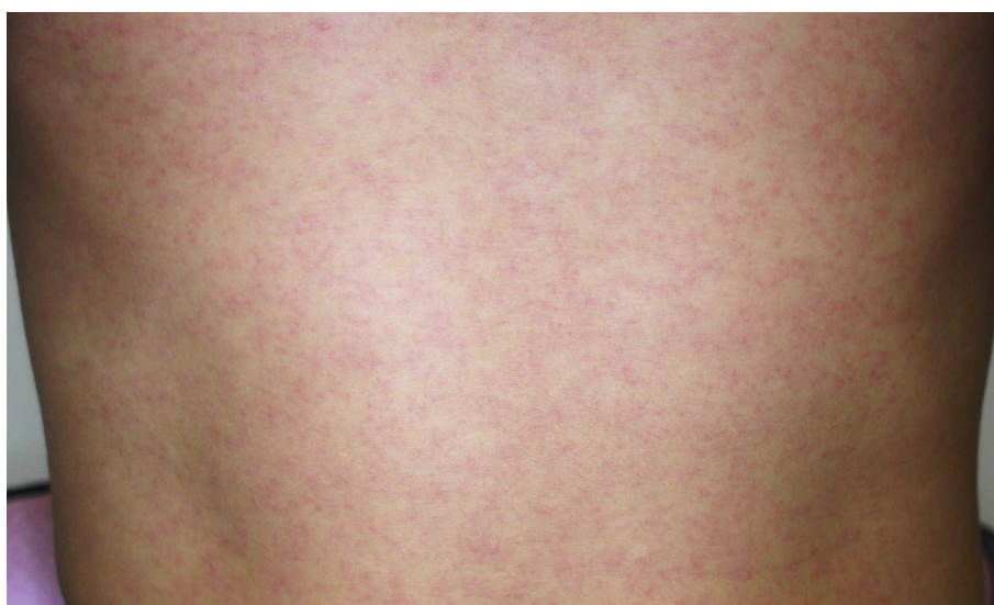
図3. ジカウイルス病の斑状丘疹様の発疹

潜伏期間は、2～12日（多くは2～7日）である。ジカウイルス病の臨床症状は多彩であるが、斑状丘疹様の発疹（ 図3 ）は90～100%に認められるのに対して、発熱の頻度は35～65%とされている 25,45,46 。また発疹は掻痒感を伴うことが多いとされている。また、大半の症例は入院を必要としなかった。 表7 に2015年のブラジル・リオデジャネイロにおけるジカウイルス病患者が発症後4日以内に認めた臨床症状を示す 45 。