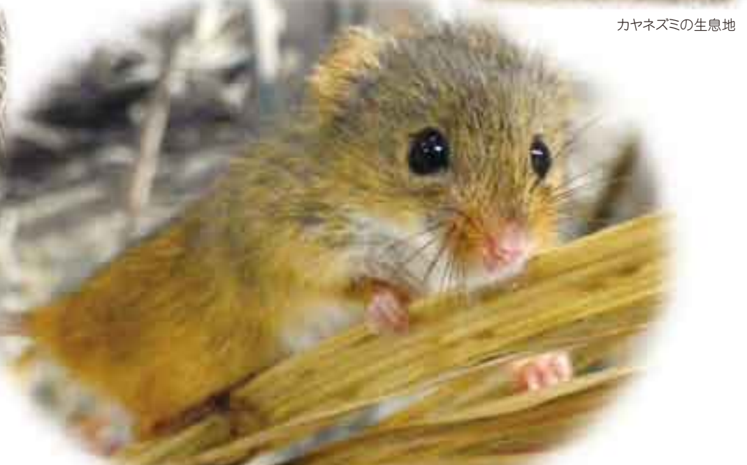
カヤネズミ (撮影：市民協働推進員 宇地原永吉)