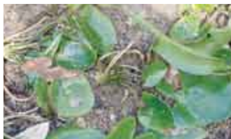
陸生形で生き延びるガガバタ

また、普段は水面に浮葉を展開するガガバタも、ため池などの生育場所が干上がった場合には、葉の形状が小さく光沢のあるものになり、ある程度の期間は耐えることができます。