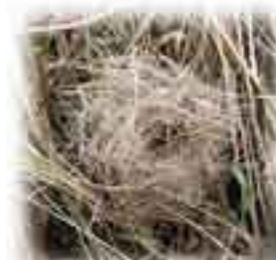
カヤネズミの球巣

本号では、調査の結果明らかになってきた、絶滅のおそれのあるなごやの生物についてご紹介します。