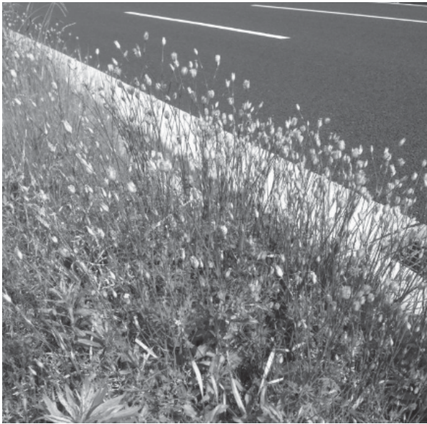
図1. コモチナデシコ属の生育環境

デシコの特徴と一致するため、ミチバタナデシコの誤りか両者が混同されている可能性がある。