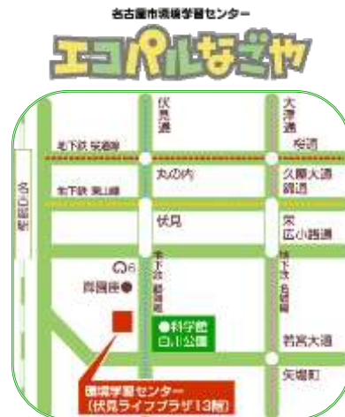
中消防署のあるビルの13階です