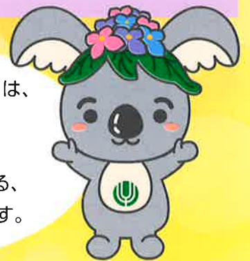
千種区マスコットキャラクター こあらっち

「いきいき支援センター」は、 高齢者のみなさまを 健康・福祉・介護など さまざまな面から支える、 名古屋市の相談窓口です。