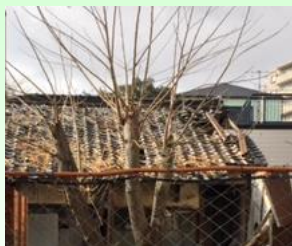
管理が不適切な 空家

管理が不適切な空家に関する情報収集を進め、市や区内関係公所との連携を密にして、区内空家の適切な管理を促進します。