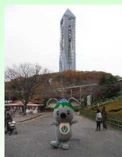
東山スカイタワー

パンフレットを作成し、区内外に区の魅力をPRするとともに、区民の皆さまが地域の魅力を再発見できる機会をつくります。