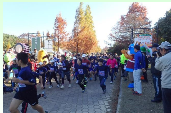
家族ジョギング・ウォーキング大会