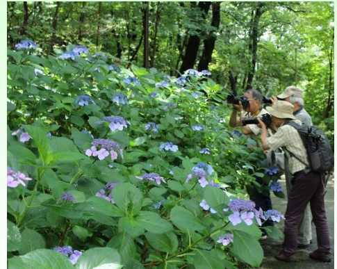
アジサイ写真撮影講習会

6月の「千種区アジサイ月間」を中心に、ボランティアによるアジサイの講習会を実施するとともに、区内全域でアジサイの植栽をすすめ、区の花「アジサイ」を広めます。