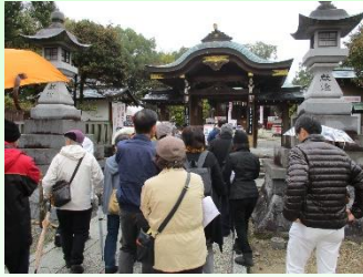
まちあるきイベント