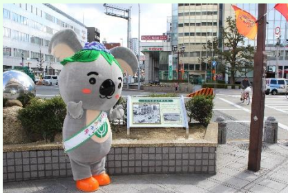
銘板を紹介する「こあらっち」

また、区役所1階「あじさいひろば」において来庁者の方々をお迎えするとともに、新たに着ぐるみ1体を制作し、区のイベントへの参加や地域への貸し出しの充実を図り、区内外に発信します。