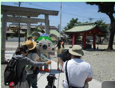
「こあらっちのお散歩レポート」 撮影風景

事業として、千種区内の魅力ある施設や街並み等を紹介する映像を作成し、広く区民の皆さまへ発信します。