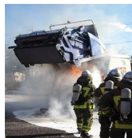
実際に起きた収集車の火災