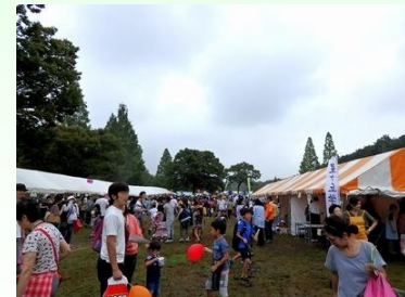
出展者テントコーナー