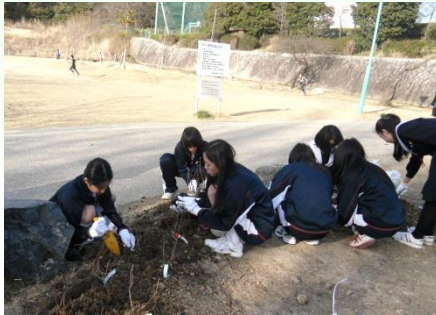
東星ふれあい広場でのアジサイの植樹