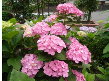
区役所東側花壇のアジサイ