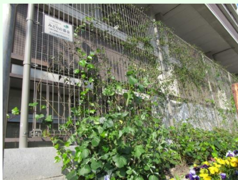
区役所南側の緑のカーテン