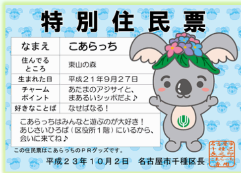
「こあらっち」の特別住民票

区の魅力を伝える「こあらっち」を皆さまに親しまれるキャラクターとして育てます。また、区役所1階「あじさいひろば」において来庁者をお迎えするとともに、区のイベントへの参加や、地域への貸し出しを通して区内外に発信します。 (まちづくり推進室 753-1823)