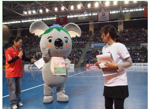
健康フェスタへ参加した「こあらっち」