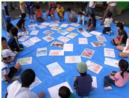
かるた大会の様子