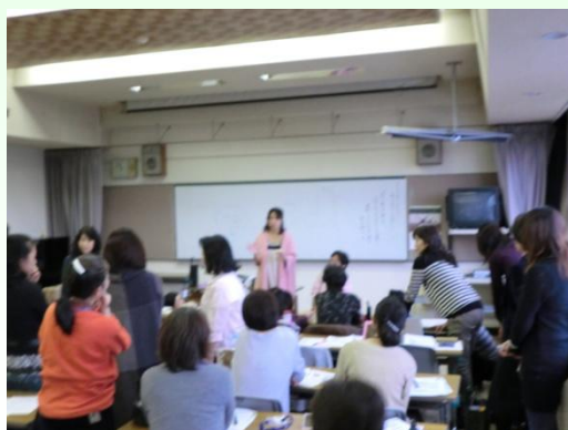
メイクボランティアの様子