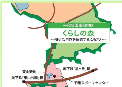
平和公園くらしの森

懐かしい里山の風景が再現された「平和公園くらしの森」において、地元の小学生などによる稲刈りやサツマイモ掘りの体験を通して、いのちのつながりを感じられる機会をつくります。 (東山総合公園 782-2111)