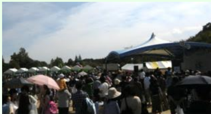
23年度は10月2日に平和公園メタセコイア広場で開催しました。