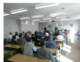
高齢者交通安全教室