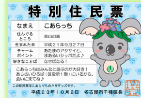
こあらっちの特別住民票

マスコットキャラクター「こあらっち」を育て、アジサイいっぱい運動や、千の種かるたを活用した区の魅力発信を行います。また、東山地区での自然を生かした体験や、千種区の歴史探訪、ご当地グルメの発案、地域を元気にする異世代交流を実施します。