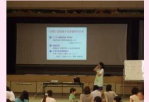
こあらっち広場の様子