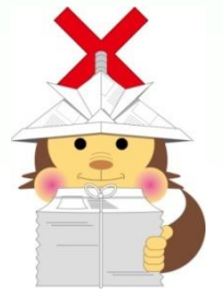
古紙の持去り防止

ごみ・資源の分別の推進、古紙持去り防止、緑のカーテンを広める取り組みを実施します。