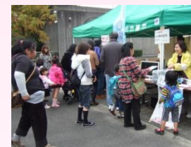
東山動物園で行った出張健康相談