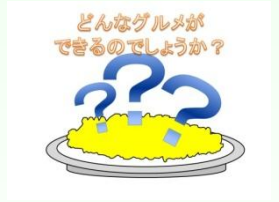
ご当地グルメの発案