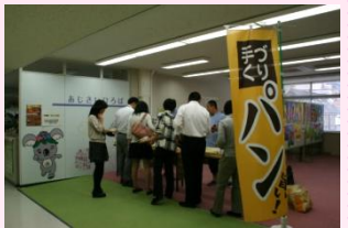
授産施設の食品販売