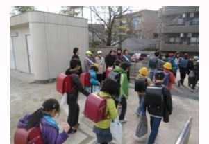
子どもの見守り活動