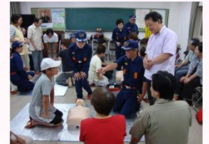
消防団員による救命講習