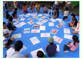
かるた大会の様子