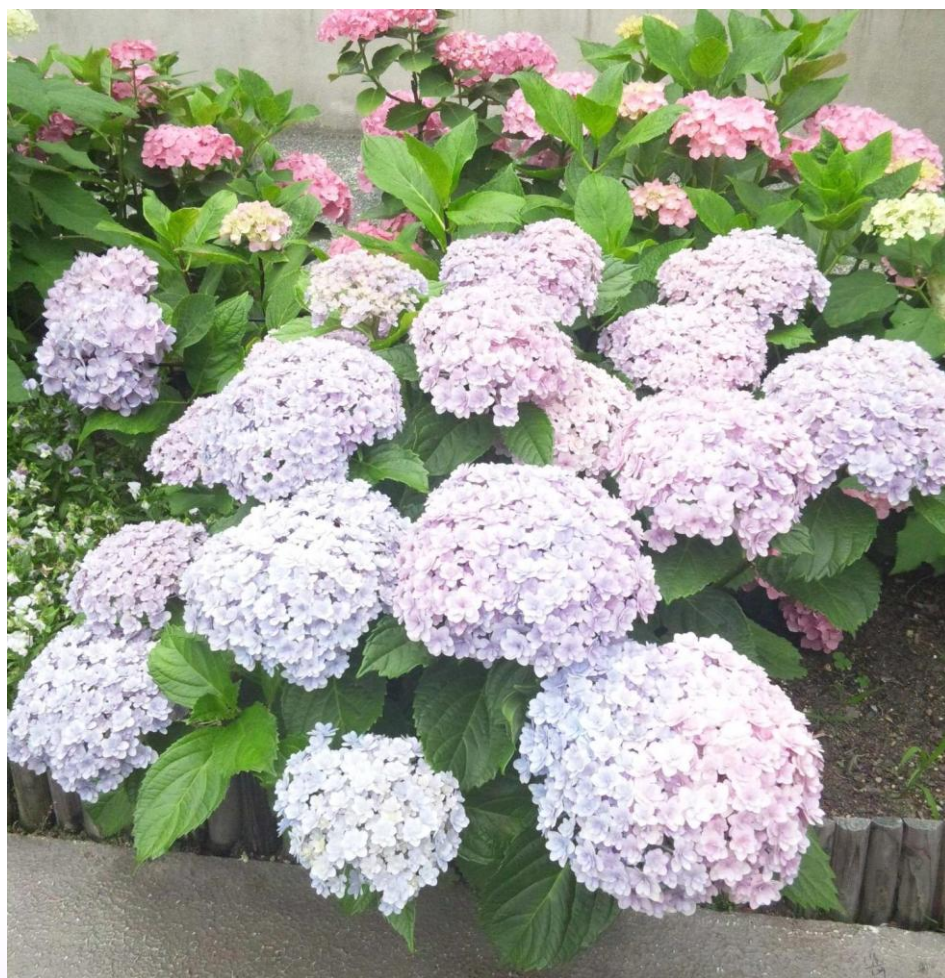
(区役所花壇のアジサイ)