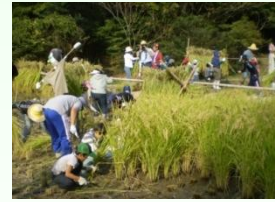
平和公園くらしの森