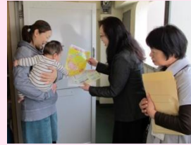
エンゼル訪問の様子

エンゼル訪問、子育てサロン、子育て広場、こあらっち広場、ちくさふれあい1/2成人式、児童虐待防止の取り組みなどを実施します。