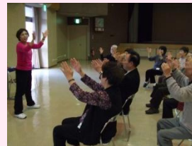
地域介護予防教室の様子

高齢者の健康支援、高齢者見守り地域支援ネットワークの推進、なごやか収集、認知症防止の取り組み、出前回想法などを実施します。