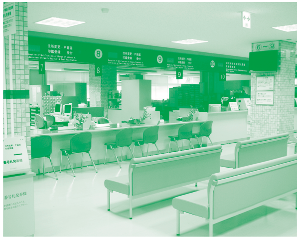
リニューアル後の市民課窓口