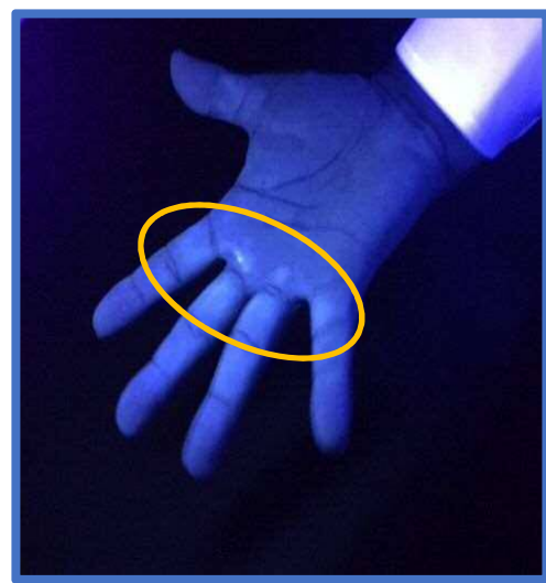
1 回目の手洗い後 少し汚れが残っています